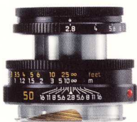
LEICA ELMAR-M 1:2,8/50 mm

C'est l'objectif universel de choix quand une taille et un poids réduits sont plus importants qu'une très forte luminosité. Très plat et maniable, il est équipé d'une optique excellente. Existe en chromé argent.