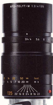
LEICA APO-TELYT-M 1:3,4/135 mm

Le Tri-Elmar comporte deux éléments asphériques et associe haute performance optique et souplesse d'emploi : en un tournemain, le photographe peut choisir entre trois focales typiquement M, sans que la mise au point soit remise en cause ! Léger et compact, le Tri-Elmar est un compagnon de voyage idéal.