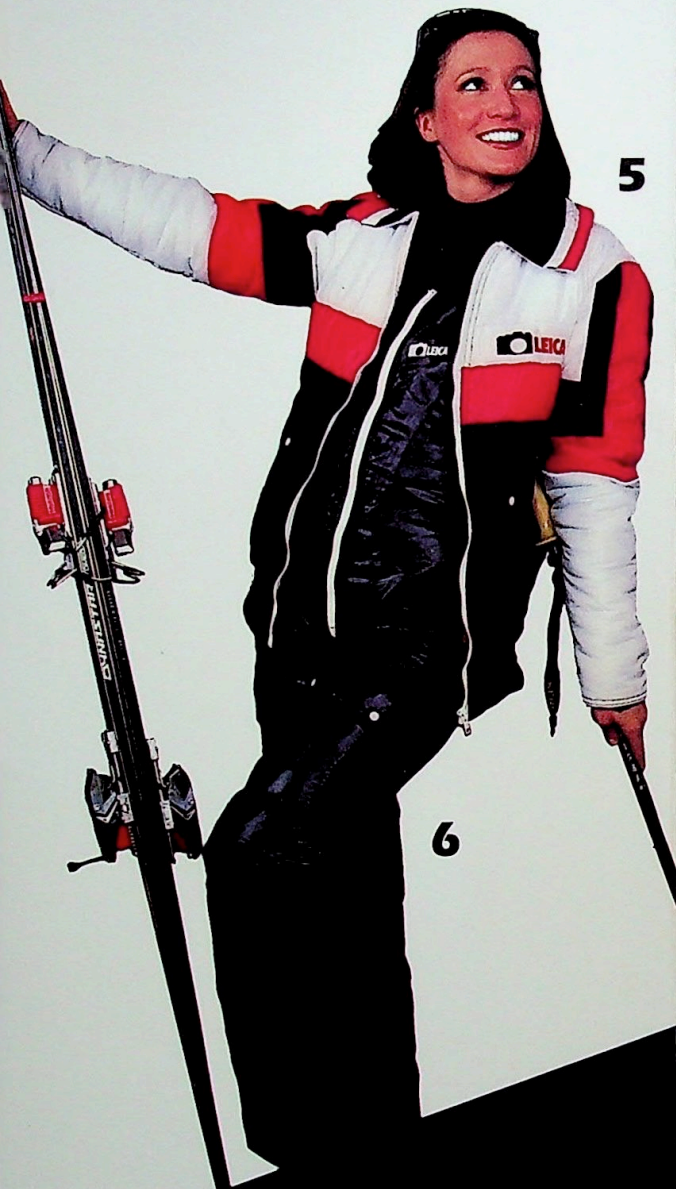
5 Blouson d'hiver