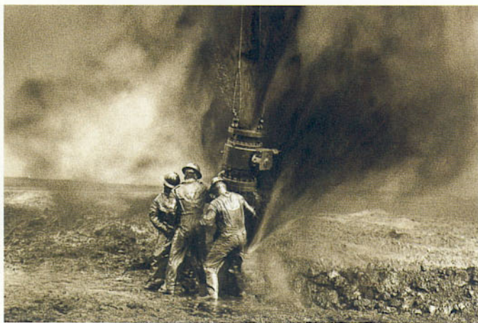
Sebastião Salgado dans les champs de pétrole en flammes du Koweït;

Le design intemporel du LEICA R6.2 exprime déjà sa finalité: la perfection de l'image. Cette recherche distingue la photographie Leica depuis plus de 75 ans et a contribué à rendre la qualité Leica proverbiale. Le LEICA R6.2 est empreint de cette tradition chargée de valeurs classiques et intemporelles: Concentration sur l'essentiel pour l'épanouissement de sa propre créativité; performances touchant aux confins du techniquement réalisable; mécanique de précision fiable, conçue pour durer.