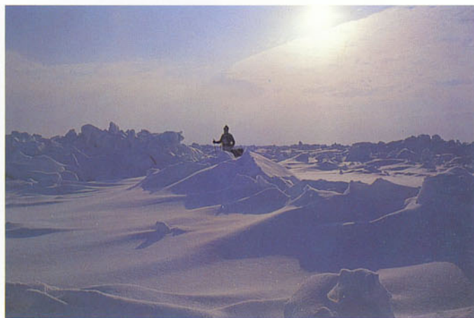
l'explorateur allemand Arved Fuchs au Pôle Nord et Sud: Les reflex mécaniques LEICA démontrent leur résistance aux plus extrêmes conditions d'utilisation.